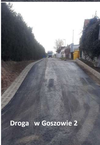
Droga w Goszowie 2