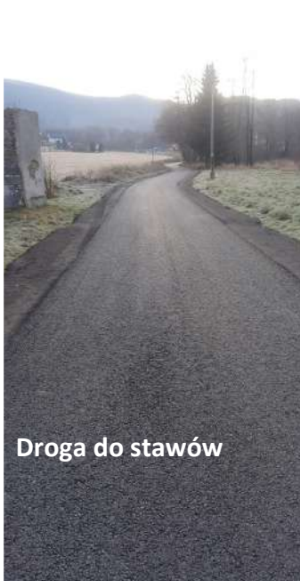
Droga do stawów