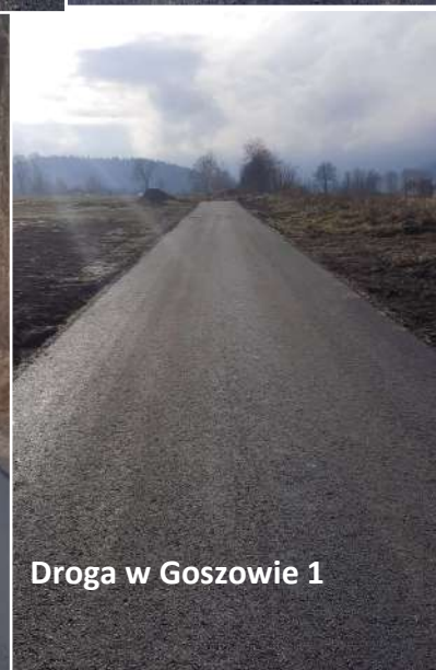
Droga w Goszowie 1