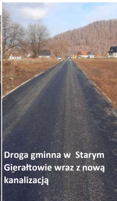
Droga gminna w Starym Gierałtowie wraz z nową kanalizacją