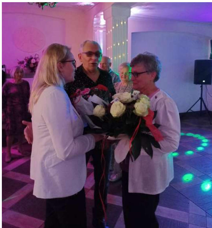
Zarząd PZER i I Oddział Rejonowy Stronie Śląskie