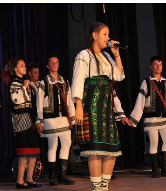
koncert rumuńskiego zespołu Ciobanasul