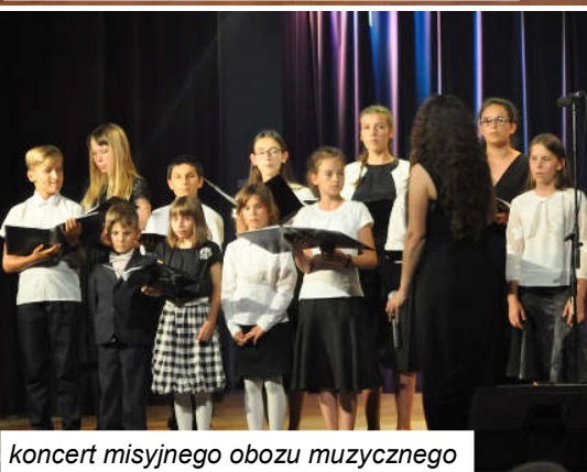
koncert misyjnego obozu muzycznego