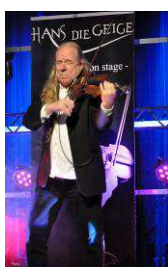
KONCERT HANS DIE GEIGE LIVE